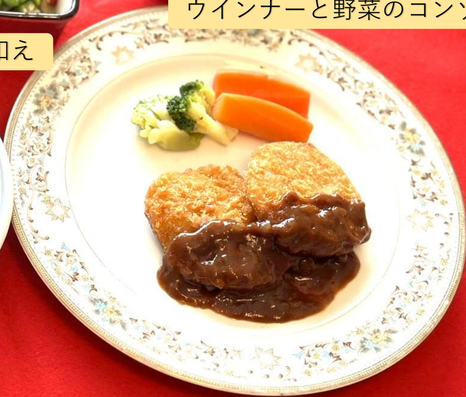
チキンカツ（オニオンソース）