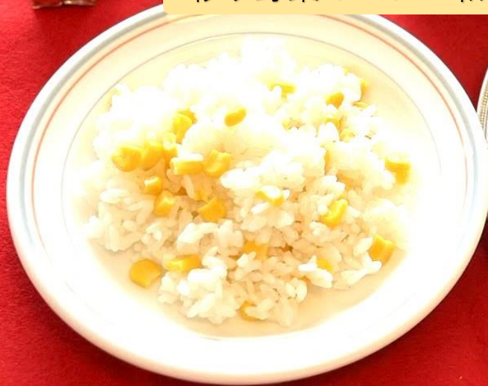
とうもろこしご飯