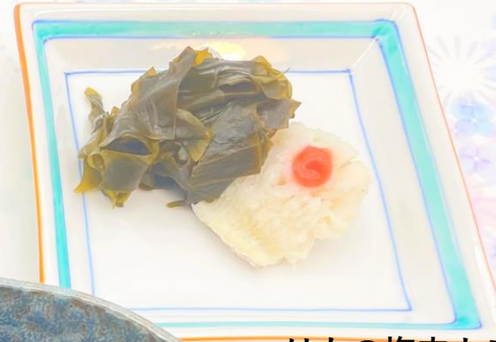
はもの梅肉よごし