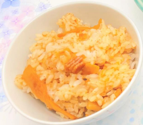
はもとはも子の混ぜごはん