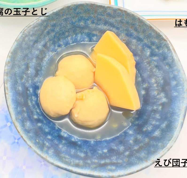
えび団子と筍の煮物

入梅とは、梅雨の季節にはいることです。 この季節に旬のはも食材をお楽しみください。